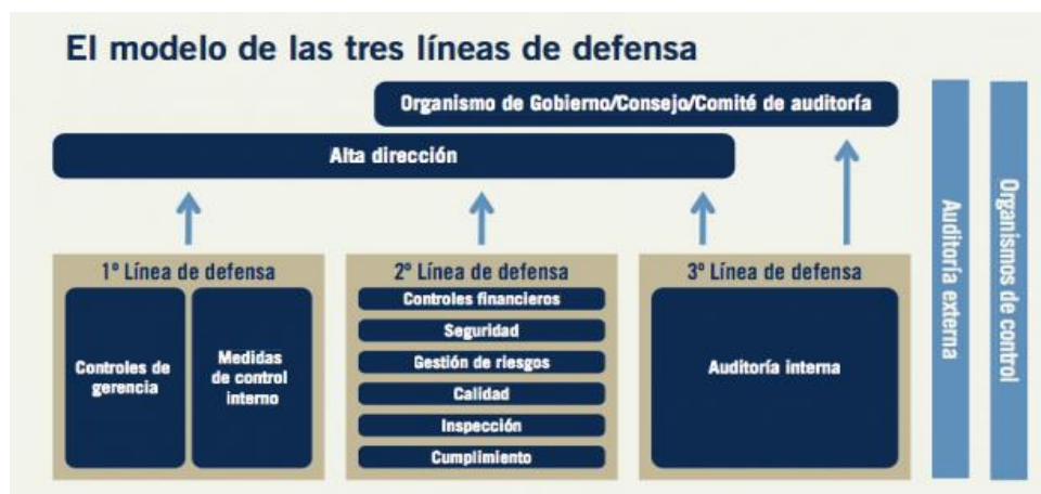
Cuadro II. El modelo de las tres líneas de defensa.

Debido a que cada organización es única y puede variar según situaciones específicas, no hay una forma "correcta" para coordinar las Tres Líneas de Defensa. Sin embargo, al asignar las responsabilidades específicas y de coordinación entre las funciones de gestión de riesgos, puede ser útil tener en cuenta el papel fundamental de cada uno en el proceso de gestión de riesgos.