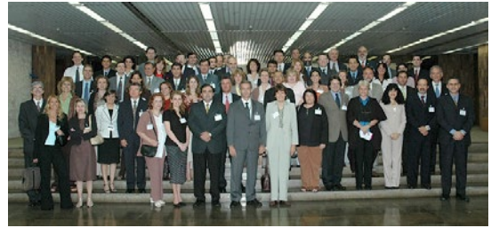
PPTB, Ano 2004, Reunião 18 do SGT4