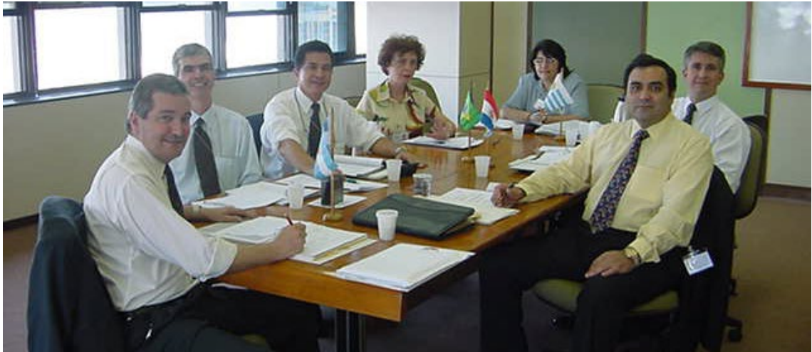
Coordenação Nacional, Ano 2002, Reunião 14 do SGT4. PPTB