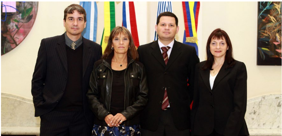
XXXIII Reunión del Subgrupo de Trabajo N°4 “Asuntos Financieros” MERCOSUR, 07 AL 11 De Mayo, Buenos Aires, Argentina Comisión de Mercados de Valores.