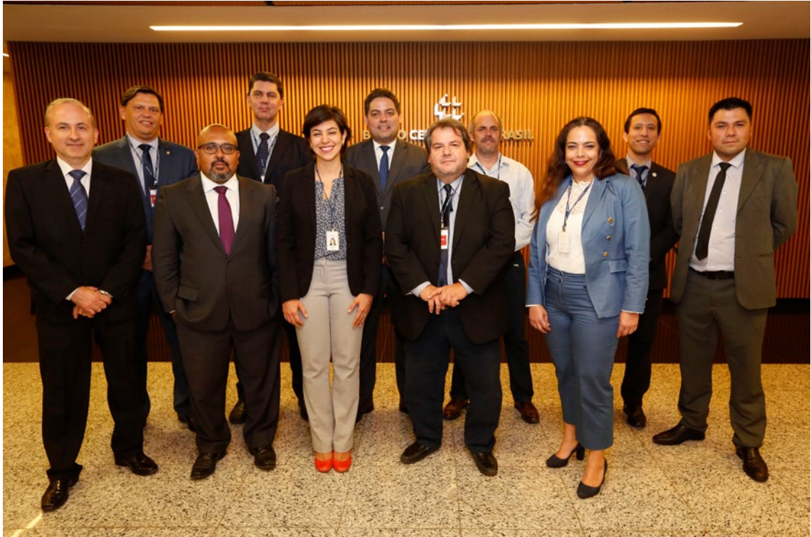
Comissão de Prevenção à Lavagem de Dinheiro e ao Financiamento do Terrorismo, Ano 2019, Reunião 42 do SGT4. PPTB

de lavagem de dinheiro e financiamento ao terrorismo, cooperação com organizações internacionais, entre outros assuntos.