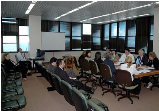
Coordenação Nacional, Ano 2006, Reunião 22 do SGT4. PPTB