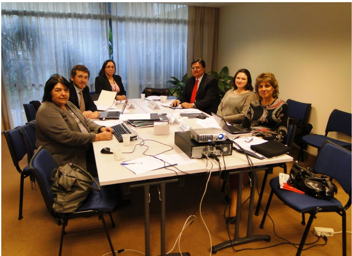
Coordenação Nacional, Ano 2011, Reunião 32 do SGT4. PPTU