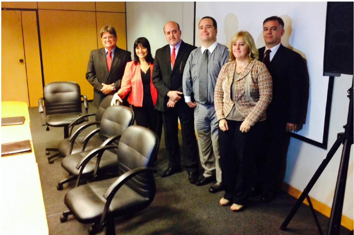
Coordenação Nacional, Ano 2014, Reunião 37 do SGT4. PPTA