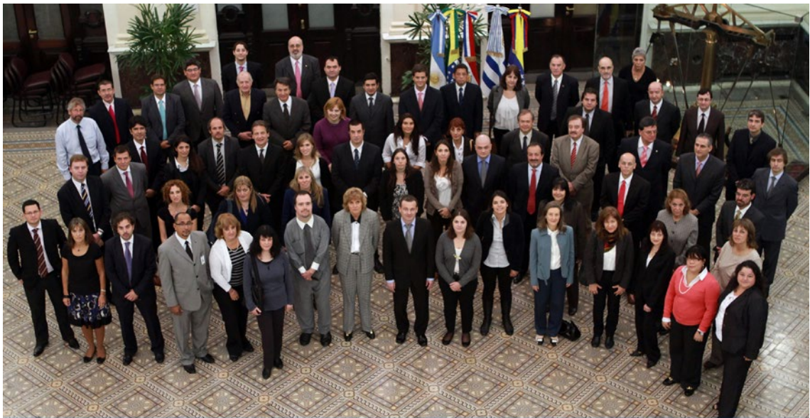
XXXIII Reunión del Subgrupo de Trabajo N°4 “Asuntos Financieros” MERCOSUR, 07 AL 11 De Mayo, Buenos Aires, Argentina Foto Grupal.