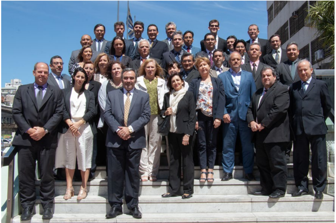
PPTU, Ano 2018, Reunião 44 do SGT4