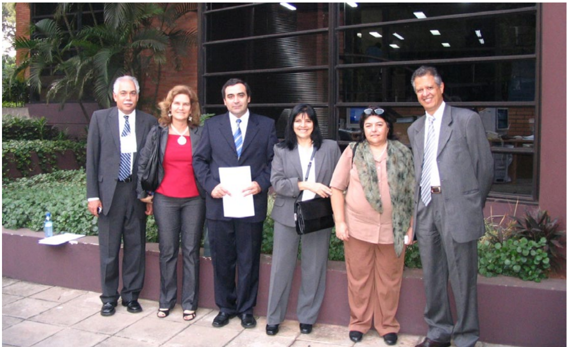
Coordenação Nacional, Ano 2007, Reunião 23 do SGT4. PPTP

O setor financeiro, que abarca o sistema bancário, o de mercados de capitais e de seguros, passa por processos acelerados de sofisticação e aperfeiçoamento institucional e regulatório. Os desafios do cenário internacional somam-se ao habitual dinamismo daqueles setores, gerando desafios não triviais para a gestão de um processo de liberalização firme, porém responsável e sustentável.