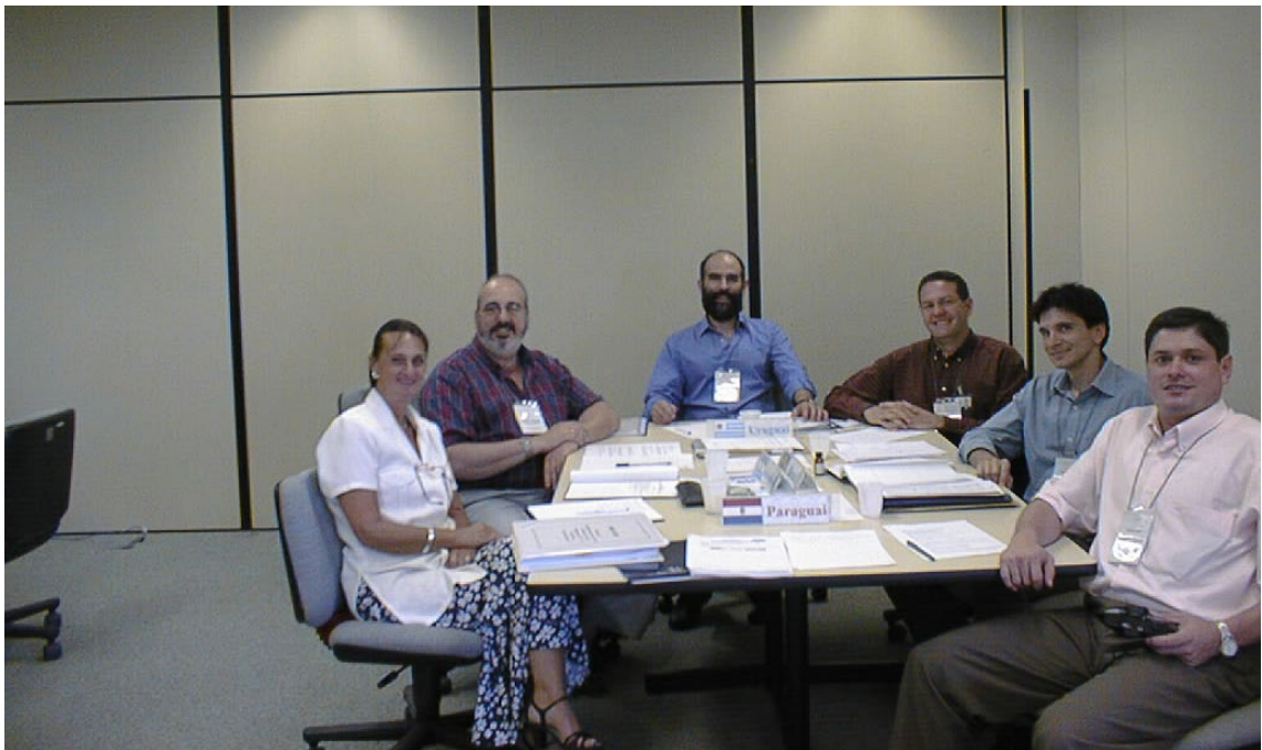
Subcomissão de Demonstrações Contábeis, Ano 2000, Reunião 10 do SGT4. PPTA