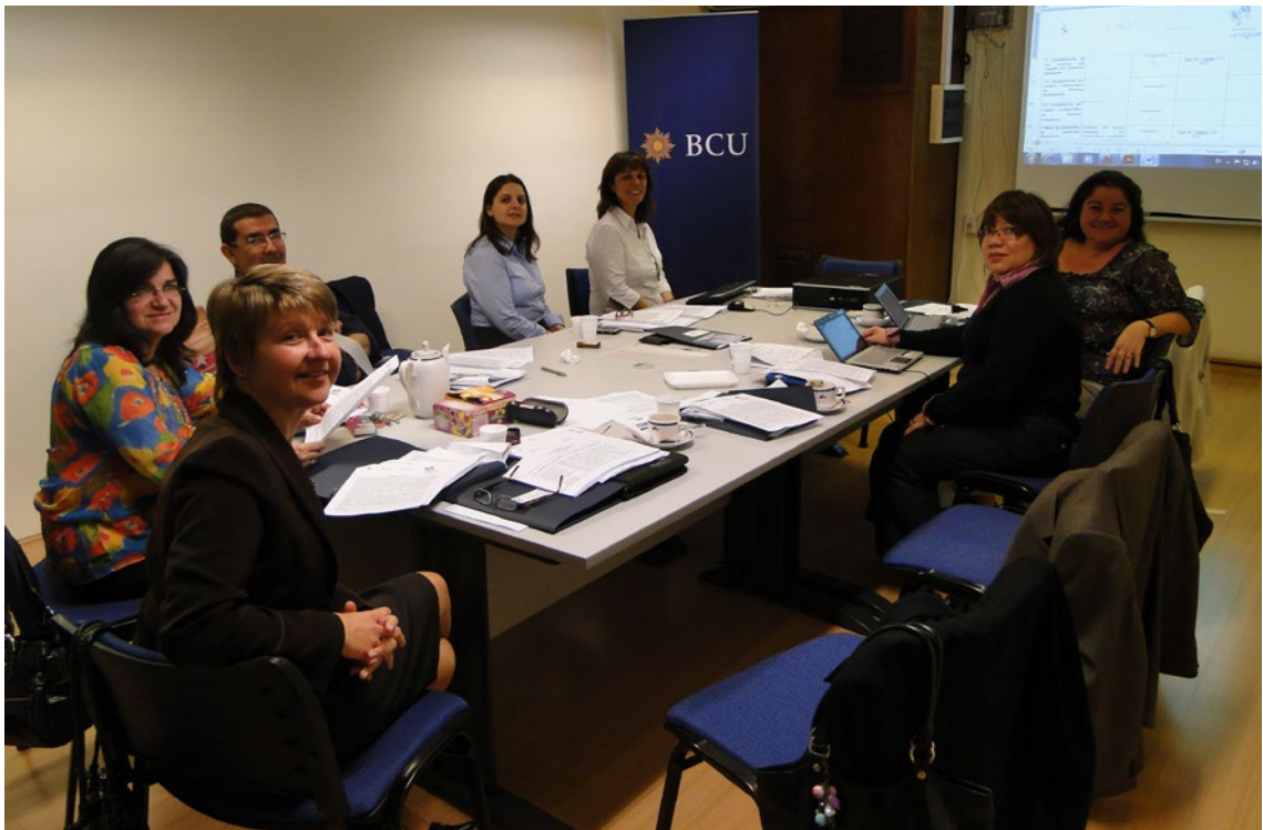
Comissão do Sistema Bancário, Ano 2011, Reunião 32 do SGT4. PPTU