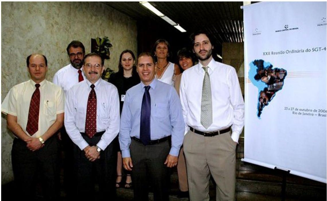
Comissão do Mercado de Valores Mobiliários, Ano 2006, Reunião 22 do SGT4. PPTB

Seus principais objetivos são manter controle do processo de regulamentação do mercado nos países-membros e harmonizar normas e práticas de supervisão para alcançar a integração dos referidos mercados.