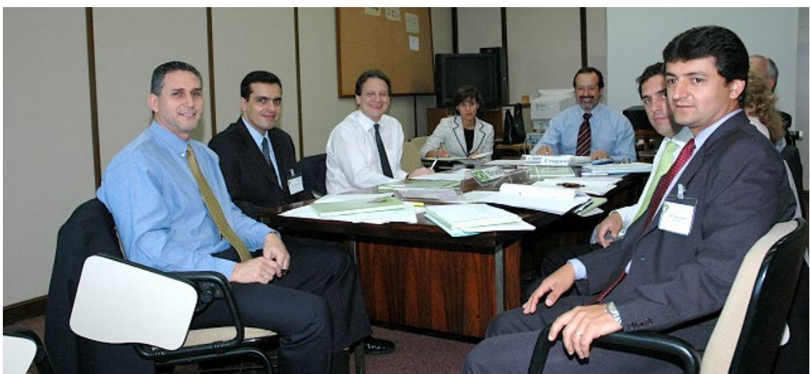
Comissão de Prevenção à Lavagem de Dinheiro e ao Financiamento do Terrorismo,, Ano 2004, Reunião 18 do SGT4. PPTB