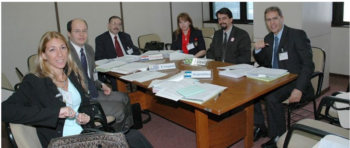
Comissão do Mercado de Valores Mobiliários, Ano 2004, Reunião 18 do SGT4. PPTB