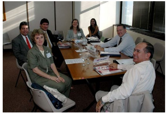
Comissão do Sistema Bancário, Ano 2006, Reunião 22 do SGT4. PPTB