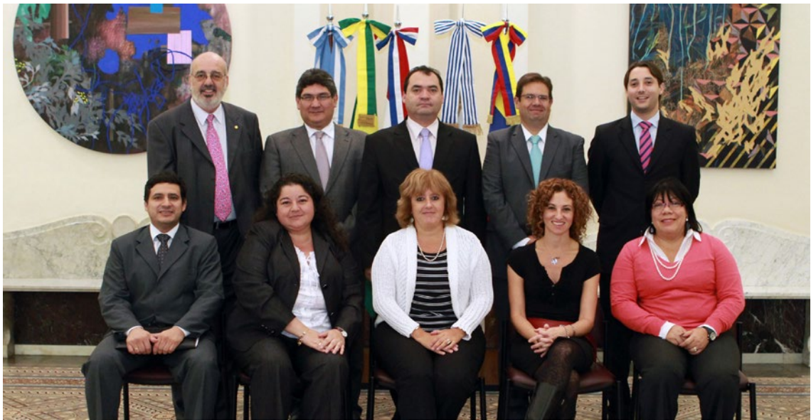
Subcomissão de Demonstrações Contábeis, Ano 2012, Reunião 33 do SGT4. PPTA