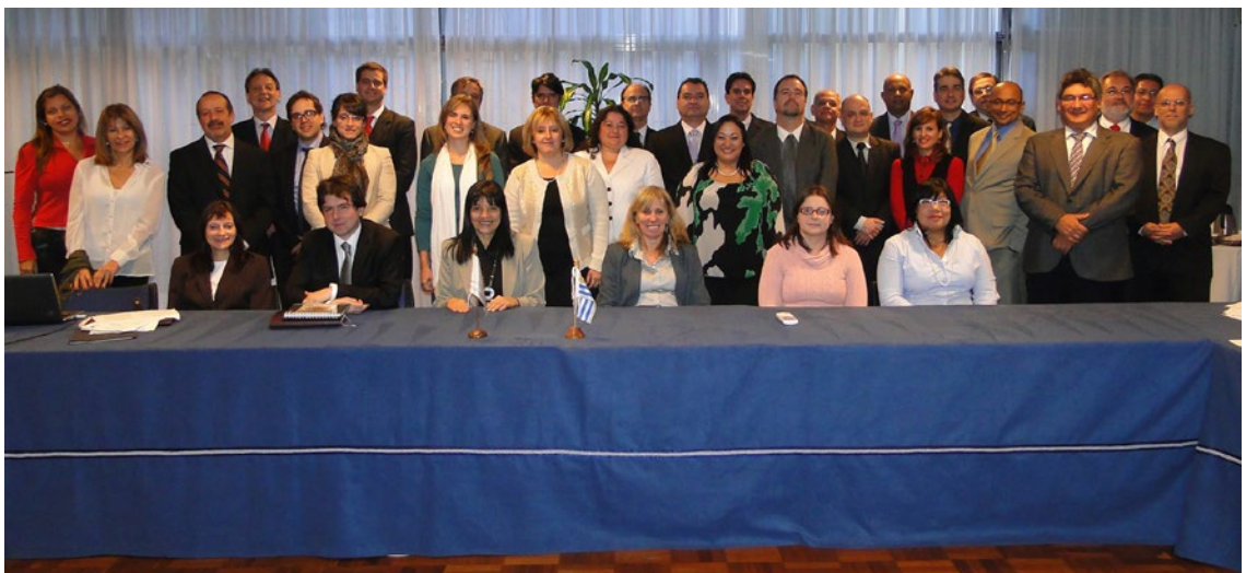
PPTU, Ano 2013, Reunião 35 do SGT4