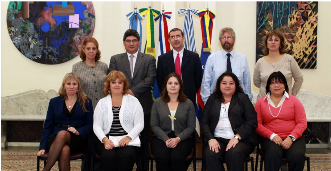
Comissão do Sistema Bancário, Ano 2012, Reunião 33 do SGT4. PPTA

Desde o início dos trabalhos, a CSB busca o alinhamento da regulação e das práticas de supervisão aos princípios básicos de supervisão bancária eficaz (também referenciados como Basel Core Principles , em inglês). Esses princípios constituem um padrão abrangente para o estabelecimento de base sólida para regulação, supervisão, governança e gestão de riscos do setor bancário.