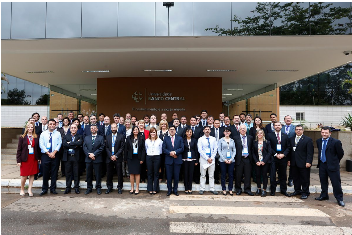
PPTB, Ano 2017, Reunião 42 do SGT4.

As decisões das comissões são obrigatoriamente acordadas por todos os países. De modo geral, as comissões discutem tecnicamente os assuntos pertinentes a suas competências, com vistas à elaboração de projetos de Resoluções (GMC) ou de Decisões (CMC). Os projetos são elevados à CN do Mercosul Financeiro para análise e revisão. Após sua aprovação, o projeto é encaminhado, nas duas línguas oficiais do Mercosul (espanhol e português), ao GMC, juntamente com uma Recomendação dos Coordenadores Nacionais do SGT-4, para que ele seja aprovado.