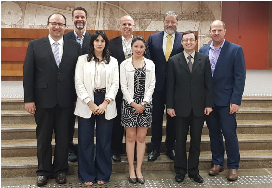
Comissão de Seguros, Ano 2019, Reunião 42 do SGT4. PPTB

A CS começou seus trabalhos com a análise comparativa do setor de seguros em cada país-membro, a identificação de assimetrias e abordagem de questões de acesso a mercados, bem como a emissão de recomendações mínimas.