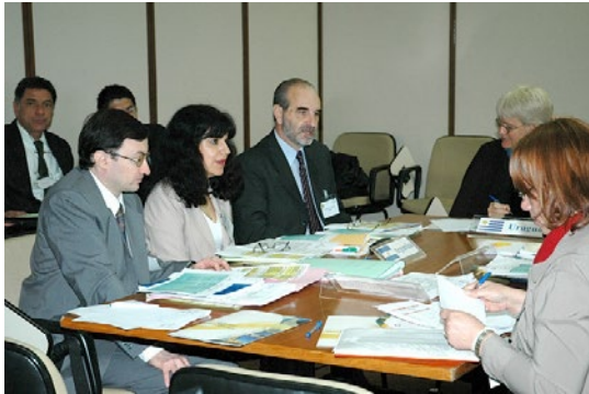
Comissão de Seguros, Ano 2004, Reunião 18 do SGT4. PPTB