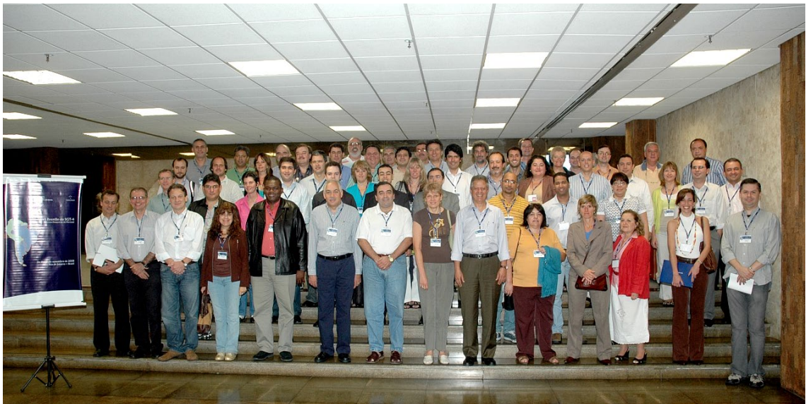
PPTB, Ano 2008, Reunião 26 do SGT4